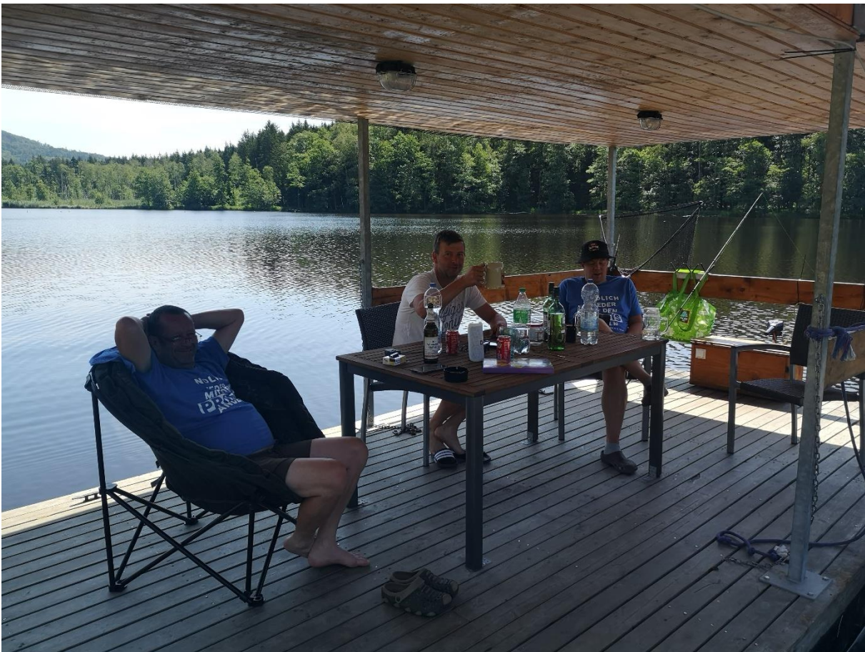
Schwimmplattform – gemütliches Zusammensein