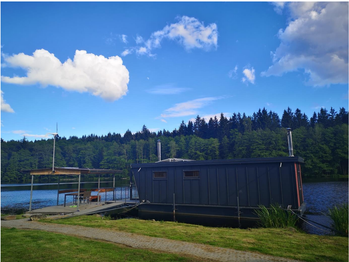
Schwimminsel und Hausboot