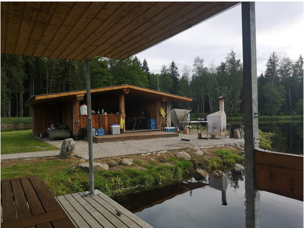
Schwimminsel mit Blick auf die Hütte