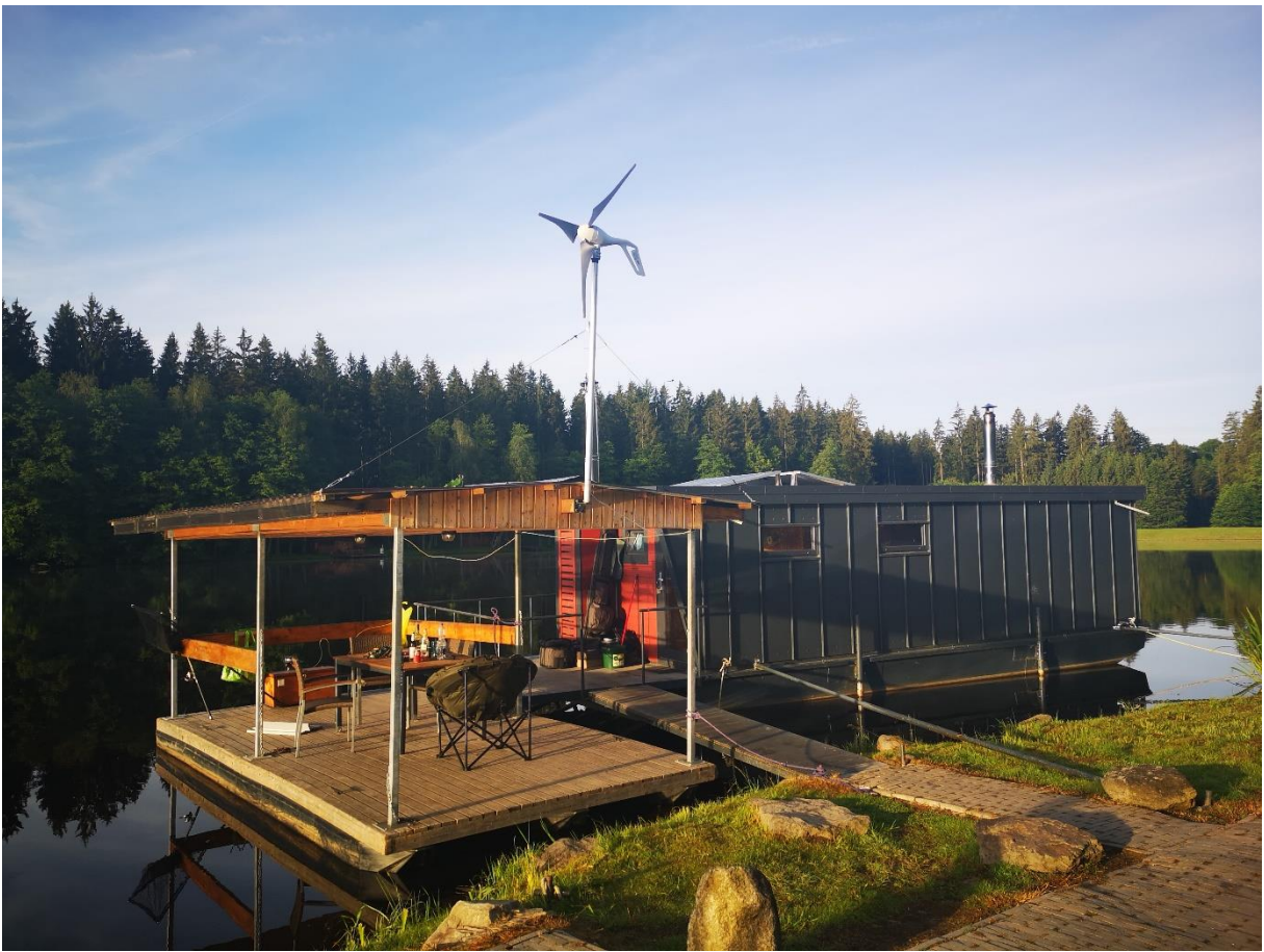
Hausboot mit Schwimminsel