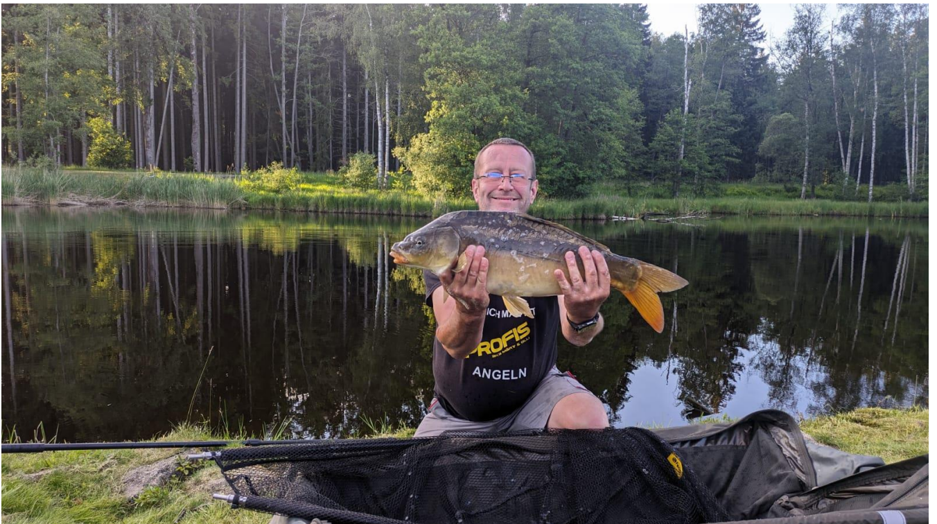
Pfutz mit Spiegelkarpfen