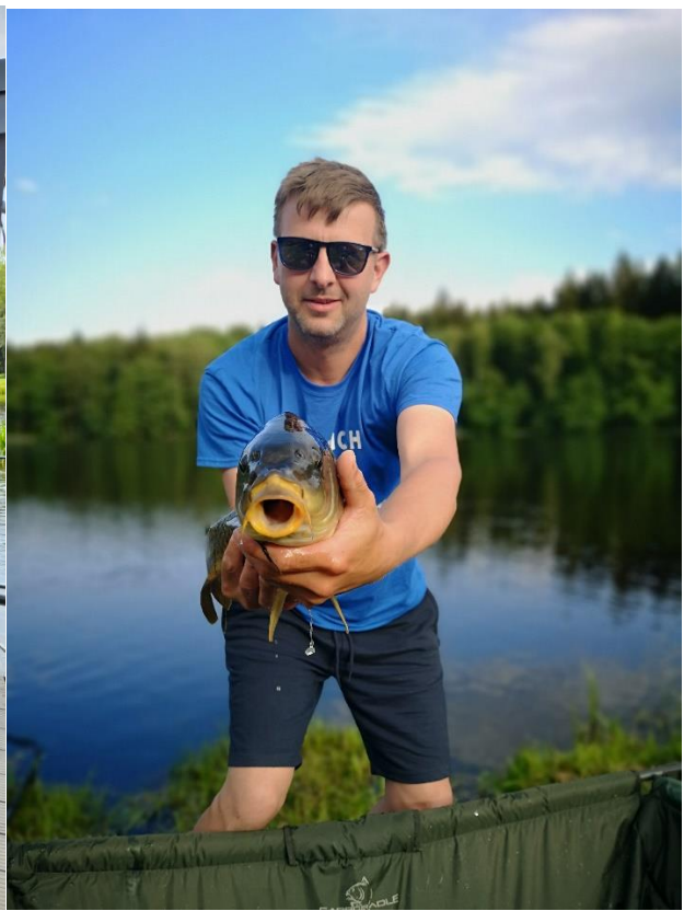
Roli mit Schuppenkarpfen