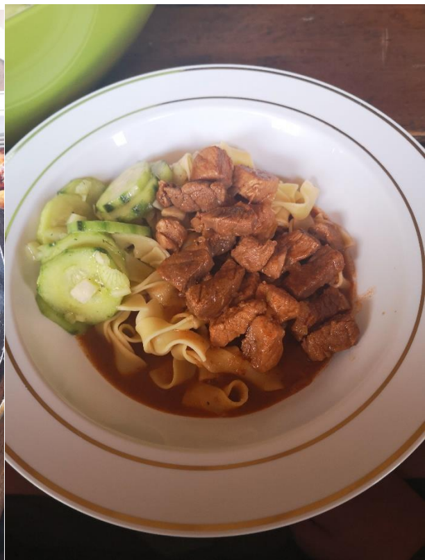
Abendessen – Schichtfleisch und Gulasch und Nudeln